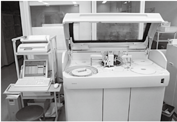
血糖や脂質などの測定機器