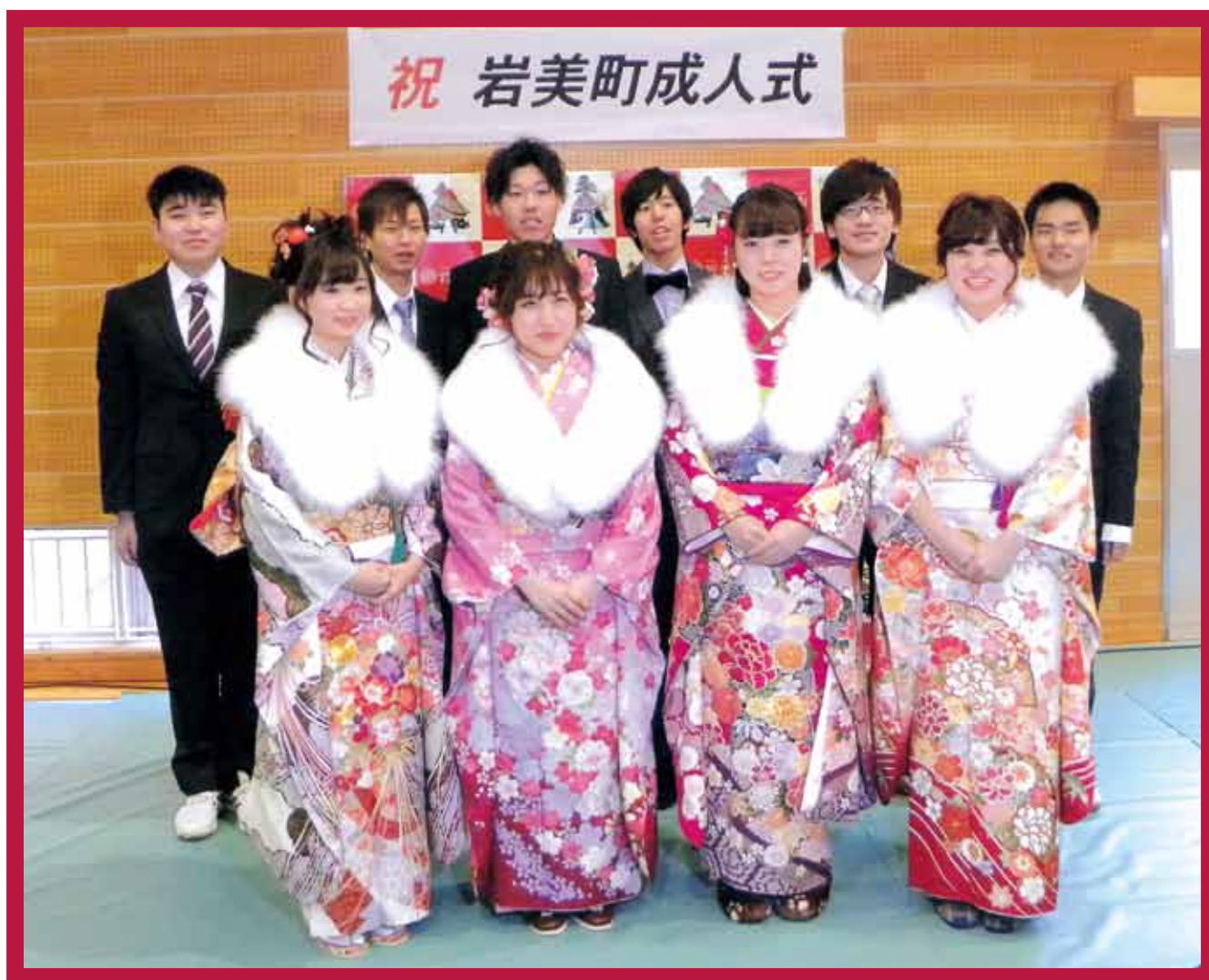
成人式実行委員のみなさん