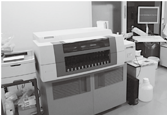
肝炎ウイルス・腫瘍などの測定機器