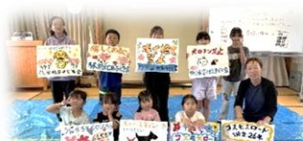
6/20 開催 コスモスロード看板づくり かわいい看板が完成しました！コスモスロードを歩く時は見てください🎵