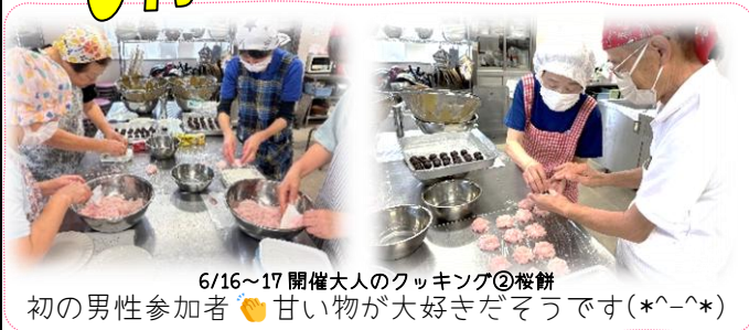
6/16～17 開催大人のクッキング②桜餅 初の男性参加者 🍡 甘い物が大好きだそうです(*^-^*)