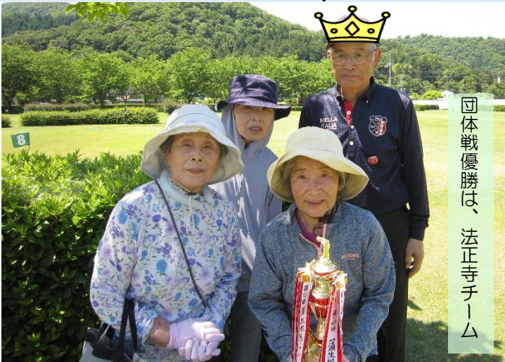
団体戦優勝は、法正寺チーム

蒲生地区グラウンドゴルフ大会の第1回大会は、平成19年に開催しています。本年度大会が第20回となります。