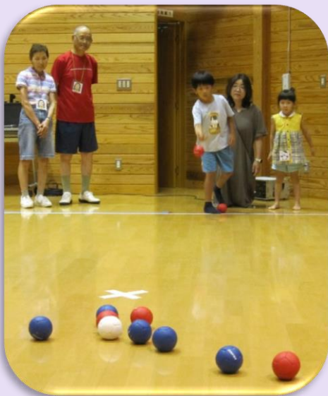
第4回ポッチャ大会の様子です。