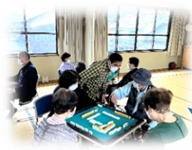
＜健康マージャンの様子＞

浦富地区公民館では、現在14のサークルが活動しており、毎日賑わっています(*^-^*) 興味のあるサークルがあれば公民館までお問い合わせいただくと、直接見学にいらして下さい！