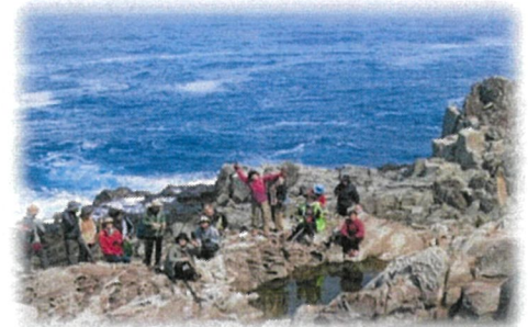
立岩 周囲1km、高さ約20mの巨岩

経ヶ岬灯台(明治31年12月25日初点灯)光は22海里(約41km)先まで届くそうで、直線距離でいうと「城崎温泉」まで。今では無人で運用されています。