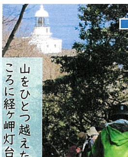
山をひとつ越えたところに経ヶ岬灯台