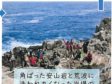
角ばった安山岩と荒波に洗われ丸くなった岩場の対比が見えました。