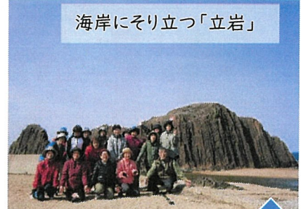
海岸にそり立つ「立岩」

早春の3月22日、山陰海岸ジオパーク最北端に位置する京丹後へ行ってきました。まずは日本三大灯台といわれる経ヶ岬灯台からの展望を満喫しました。次に遊歩道を一キロほど進み、柱状節理の岩場が経巻を立てたように見えることで経ヶ岬の名前の由来とされる海岸に降り立ちました。午後からは、屏風岩や立岩をゆっくり散策しました。