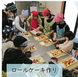
ロールケーキ作り

3月2日、親子ふれあい交流会を開催しました。中学生も参加してくれて、とても賑や一日でした。