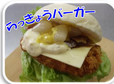
っっきょうバーガー