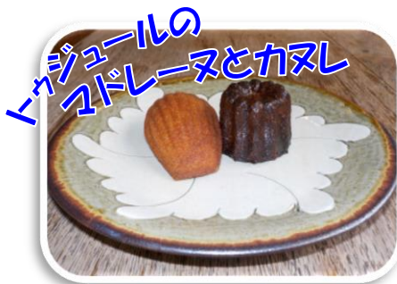
トウジュールの イブドレーヌとカヌレ