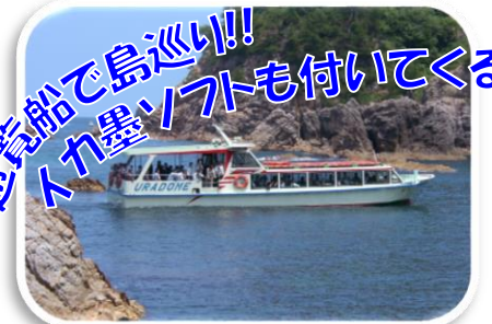
遊覧船で島巡り!! イカ墨ソフトも付いてくる