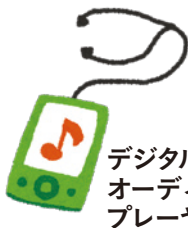
デジタル オーディオ プレーヤー