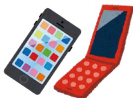
携帯電話・スマートフォン