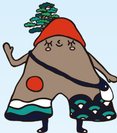
岩美町PRキャラクター いわみん