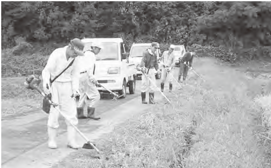
多面的機能の支払制度を活用した地域の農地維持活動（黒谷地内）

2月に計画案の公告縦覧、3月には異議申し立て期間を設けて、4月には計画決定の公告を行っている。