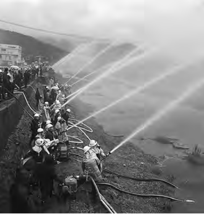
消防団出初式の一斉放水(29年1月9日)