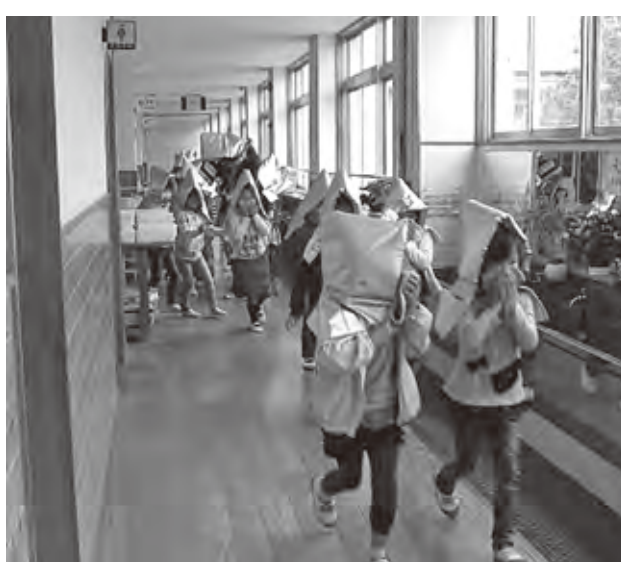
岩美西小学校の防災避難訓練

また、学校、保育所での避難行動は、一次避難と次の対応について共通認識を持つことが重要であると思っている。町内の自主防災組織の方々と改めて反省点、課題を見出していく。