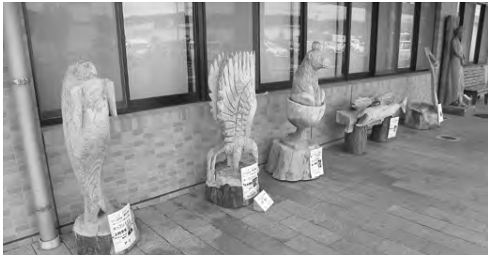
町内の各所に彫刻造形作品が展示されている。 (湧水町・いきいきセンターくりの郷前)