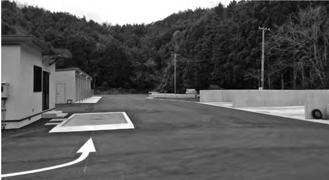
昨年6月から工事にかかっていたストックヤード

12月定例会を、12月20日から22日まで3日間の会期で開きました。 一般会計補正予算など、15議案を町長提案通り可決しました。