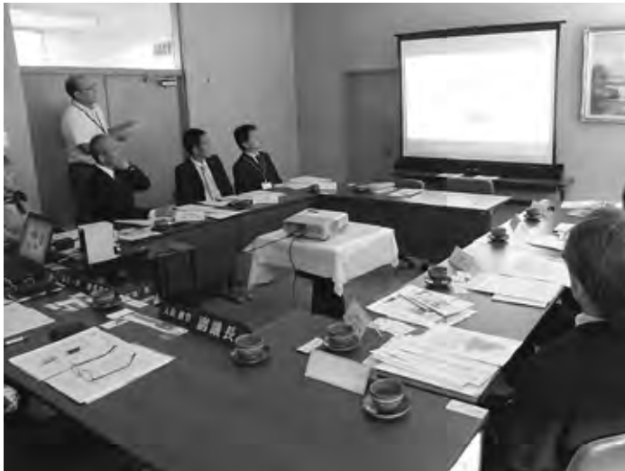
高原町の移住定住対策について調査