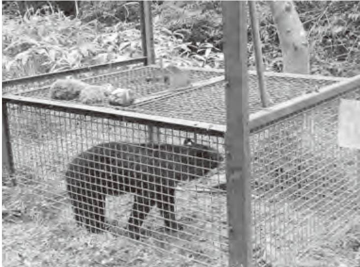
有害捕獲許可を得て捕獲した熊（荒金地内）

町長 町としては、ツキノワグマ保護計画そのものを全面的に改定してほしいと県へは要望している。鳥獣対策として、広域的な対応が必要であると感じている。