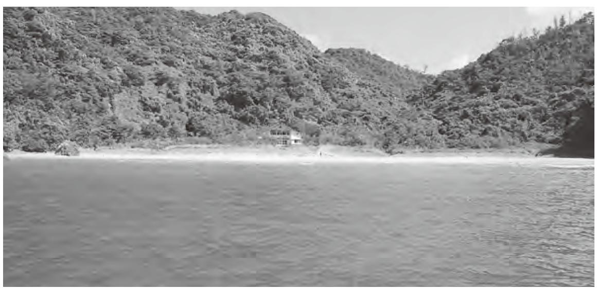
エリザベス・サンダース・ホームが臨海学校を行った熊井浜