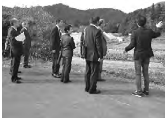
かみなか農楽舎の取り組みの説明を受ける

1. 「農地保全と後継者育成が地域活性化にとつて重要」との問題意識と熱意を行政が持ち続け、県外の若者が新規