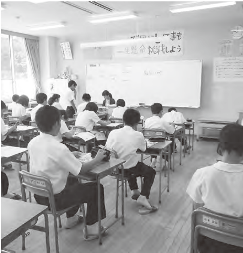
エアコンが整備されている中学校の授業

環境や近隣の市町村の様子をふまえて、今後考えていかなければならない問題だと認識している。