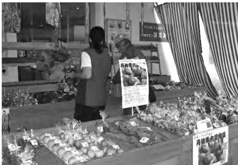
道の駅スプリングスひよし内の特産品直売「彩花彩園」

1. 旧日吉町産の薪炭、食材活用のイベントで、地元産品の発信に取り組んでいる。岩美町においても、道の駅で地元産品を活用する機会をいっそう広げること。