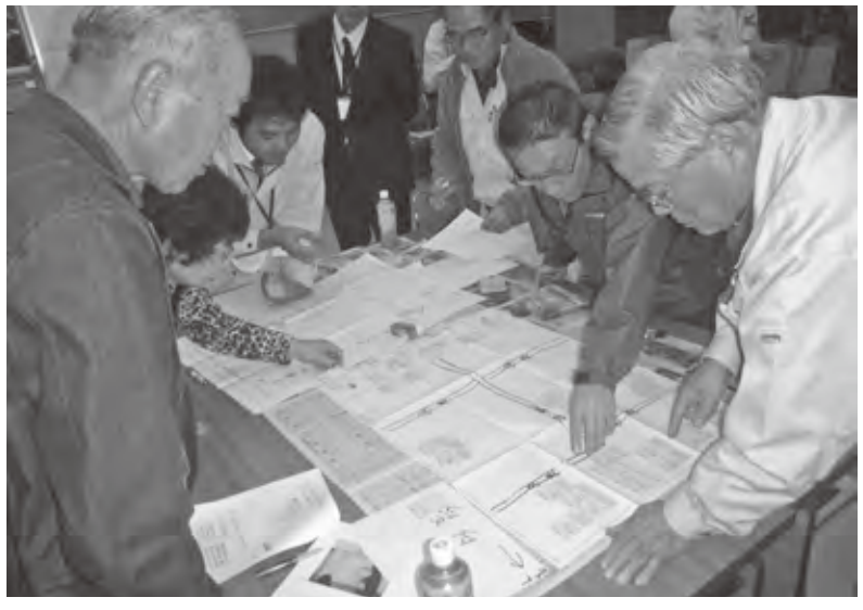
避難所運営研修会での図上訓練の様子