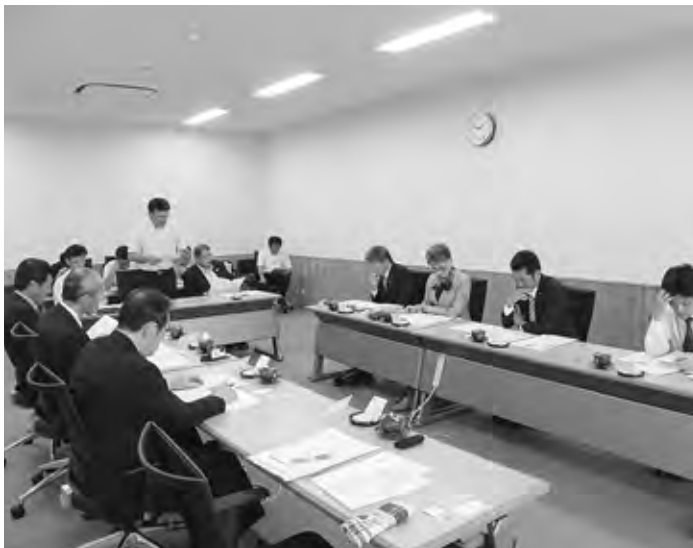
さつま町の空き家対策について調査

町民と自治体が同じ問題意識をもって解決し、それに合った政策を持ち、近隣との差別化を図っていかねばならないと感じた。