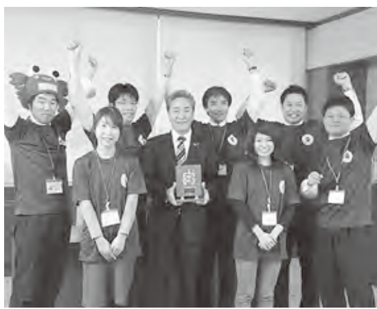
田舎暮らしの本（宝島社）の「2016年住みたい田舎ベストランキング」で総合第1位に選ばれた

町長 「まちづくりの基本目標に「まちづくりは人づくり。教育のまち」を掲げて取り組んできた。