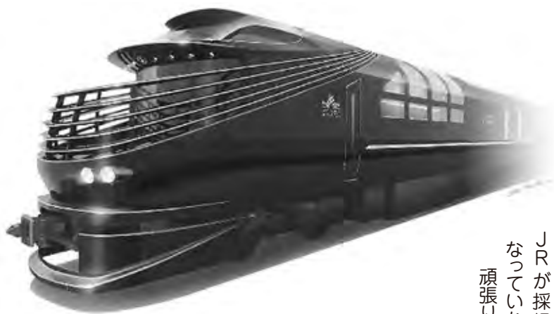
トワイライトエクスプレス瑞風