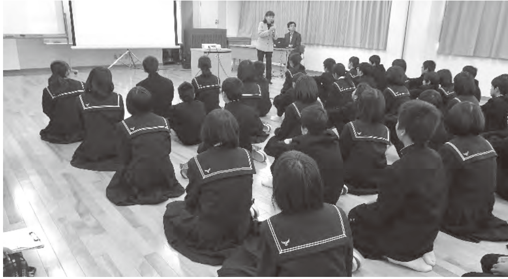
人権について考える (岩美中学校)

会や部活のことを聞くなご、中1ギャップの解消に、先生方には努力していただいている。