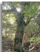
目通り直径80cmのタブノキ

社叢のほとはりは薄暗く、草本層に生える植物は少ないですが、やや明るい参道沿いにはツワブキやイノデ、ヤブソテツの仲間が見られます。