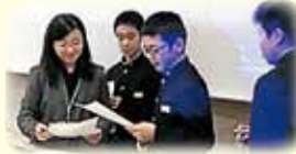
4月14日早速岩美中学校で初授業を行いました。