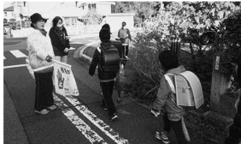
登下校の見守り活動の様子

民生委員・児童委員は、民生委員法及び児童福祉法に基づき、厚生労働大臣から委嘱された県の非常勤特別職地方公務員です。 民生委員・児童委員は、地域の身近な相談役です。生活上の心配ごとの相談や、福祉サービスを利用するためのお手伝いなど、同じ地域の一人として相談に応じ、関係機関と手を取り合います。 いさまたまな形で支援活動を行っています。守秘義務があり、相談内容や秘密が外に漏れることはありませんので安心してご相談ください。