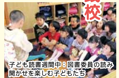
子ども読書週間中：図書委員の読み聞かせを楽しむ子どもたち

岩美南小学校では開校以来、読書意欲が高まるような工夫をしてきました。明るく利用しやすい図書コーナーの設置や地域の皆様による朝の読み聞かせを始めとし、図書委員会が行う読み聞かせや読書ビンゴ、ブックワールド集会などの催しを行っています。また、全校児童が『読書ファイル』を持ち、六年間の読書活動や学びの歩みを綴り、いつでも振り返れるような工夫もしており、これらの日々の活動が評価を受けました。 この度の受賞を励みとして、読書好きの子どもたちの育成により一層努めていきます。