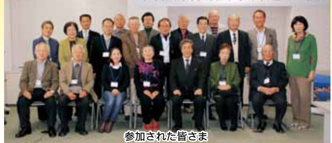
参加された皆さま

の方に生きがいを持たせる施策を」「湯布院温泉や黒川温泉の取り組みを岩井温泉の参考としては」など、岩美町への思いや町づくりへの提案等を榎本町長と意見交換しました。これからも、岩美町を応援いただける方を増やし、関西から岩美町をさらに元気にしていただけるよう取り組みを進めてまいります。