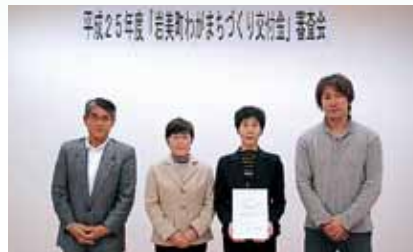
プレゼンに臨んだ皆さん

獲れても投棄されている魚など、地元の水産物を有効に活用した“おもてなし”メニューを開発し、『食』の分野からジオパークをPR。観光客のリピーター化を目指すとともに、地域の高齢者や女性の働く機会を増やすことで地区の活性化を図る。