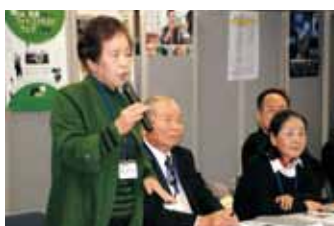
岩美町への熱い思いを語る参加者