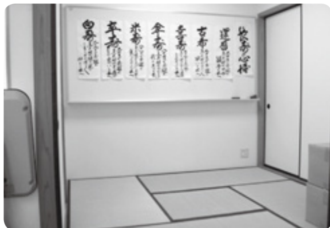
和室では、畳からの立ち座りやこたつの出入りなどの練習をします