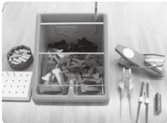
手指の筋力強化や細かい動きの訓練の器具（左）と生活を行いやすくする工夫された道具（右）