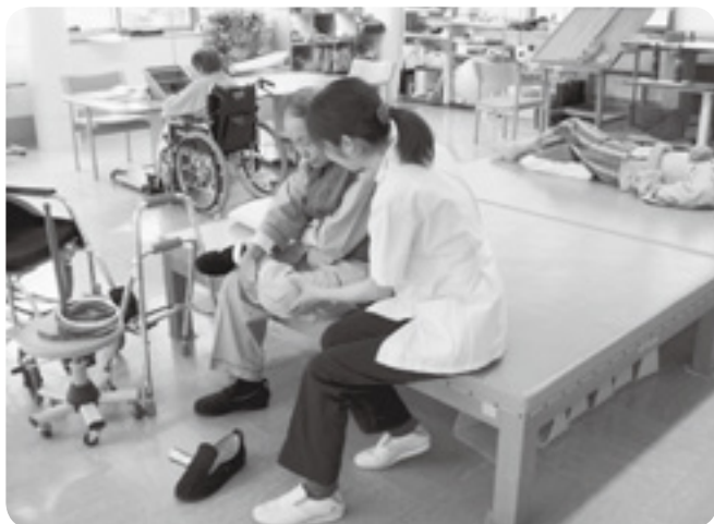
リハビリ室での訓練風景