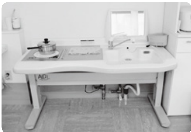
調理台がありますので調理訓練を実施できます