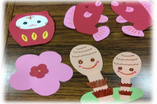
春らしいガーランドです

ガーランドとは?壁に飾り付け、ひも状に大小の色々な形をつなげたインテリアです。個性豊かなカラフルでかわいいガーランドが出来ました。部屋が華やか賑やかになりそうです。