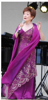
素敵な歌声にうっとりです！