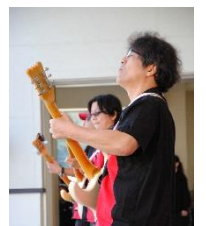
やっぱりベンチャーズはいいなあ！