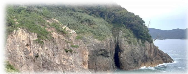
香住の海岸と岩美の海岸の景色を比べてみましょう!