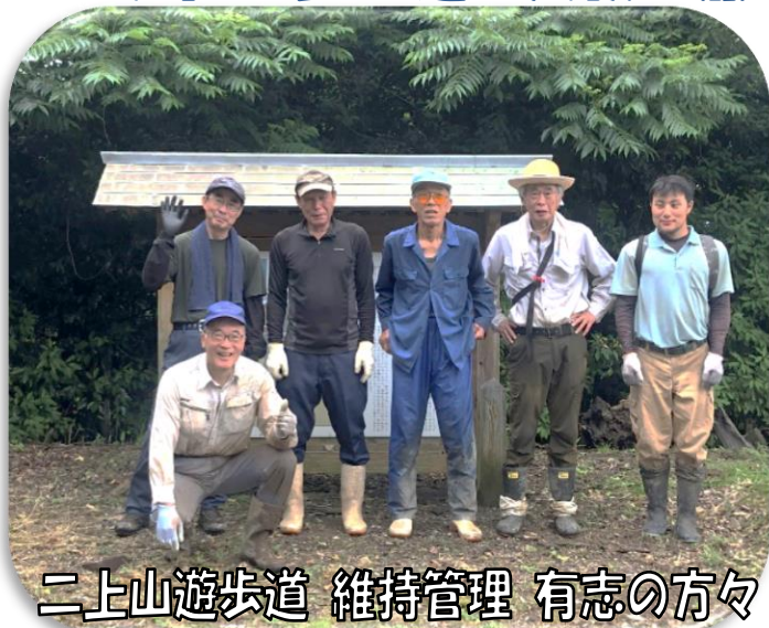
二上山遊歩道 維持管理 有志の方々

岩常は中国百名山の1つである二上山(鳥取県史跡「二上山城跡」指定)を有します。頂上までの道のりは「二上山遊歩道」として鳥取県の管轄となっておりますが県より維持管理依頼を受け、毎年部落有志(ボランティア)で二上山頂上までの登山道を点検・草刈りなどの清掃業務をしています。7月9日雨模様の中、今年も有志7人が集まり、汗だくになりながら清掃作業を行いました。これからも体力の続く限り行っていく決意です。